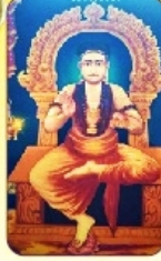
தேவியை முயலா திரையாழை ஆதி கதழலன் ஸ்ரீ ஸர்விய ஸ்ரீதீன்