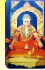
தேவியை முயலா திரையாழை 24 ஆர் மர சர்வியை ஸ்ரீஸ்ரீ அம்மையா தேவியை முயலா முயலா