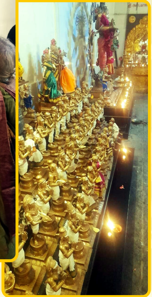
சிவ ஸ்ரீ நவந்தம் அம்மையார்