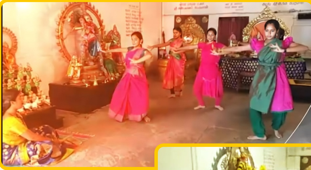
பரத நாட்டிய வகுப்பு